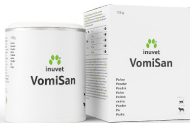
Pulver für Allergiker