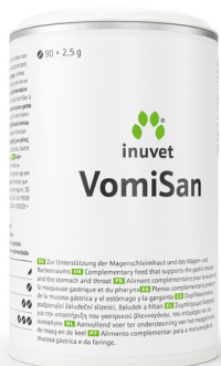
Tabletten voor allesvreters