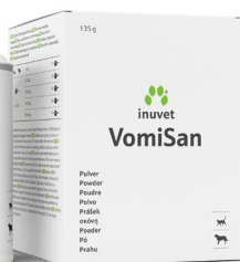
Zakjes voor halve porties