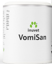
Poeder voor allergiepatiënten